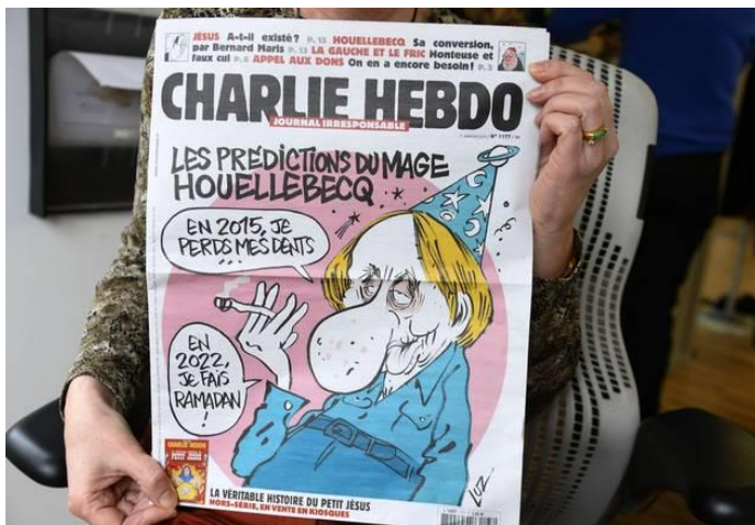
Slika 1: Naslovnica časnika Charlie Hebdo ali

Slika 1: Urednica revije predstavlja najnovejšo izdajo.